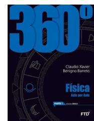
IMAGEM REFERENTE À PARTE 1 DO BOX