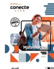
IMAGEM REFERENTE À PARTE 1 DO BOX