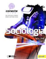
IMAGEM REFERENTE À PARTE 1 DO BOX