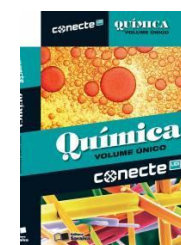
IMAGEM REFERENTE À PARTE 1 DO BOX

CONECTE – QUÍMICA VOLUME ÚNICO (BOX) USBERCO E SALVADOR 1ª EDIÇÃO - 2014 EDITORA SARAIVA ISBN: 9788502223295